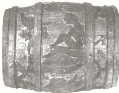
Barril tallado. Gauguin

Al respecto, es necesario, comentar que prácticamente tuve que obligar o exigir a los alumnos a incursionar en el uso de las computadoras y del INTERNET porque, aunque la mayoría cuentan con computadora e internet en sus casas y en las escuelas donde trabajan y que tienen hijos o parejas que saben el manejo de estas herramientas, muestran resistencia a aprender y utilizar estas tecnologías. Les comentaba a los alumnos del analfabetismo que vivimos en cuanto al dominio de estos medios de comunicación y de la necesidad de adquirir competencia comunicativa en este ámbito de las nuevas tecnologías, pues todo parece indicar que la tendencia es la informatización y virtualización -si es válido el uso de este término- de vastos campos de la vida cotidiana (compras por línea, acceder a algunos servicios como el pago de luz, teléfono, tarjetas de crédito y próxima