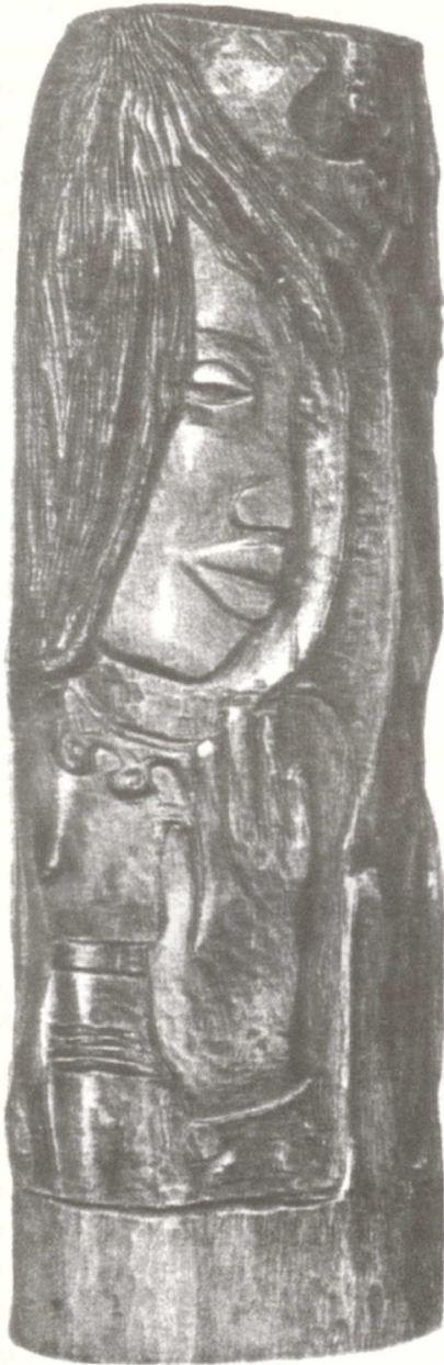
La siesta de un fauno. Gauguin

Otra actividad en la que he incursionado y pienso incursionar nuevamente es el uso del video, en semestres anteriores he utilizado un video para presentar un panel de discusión en tor-