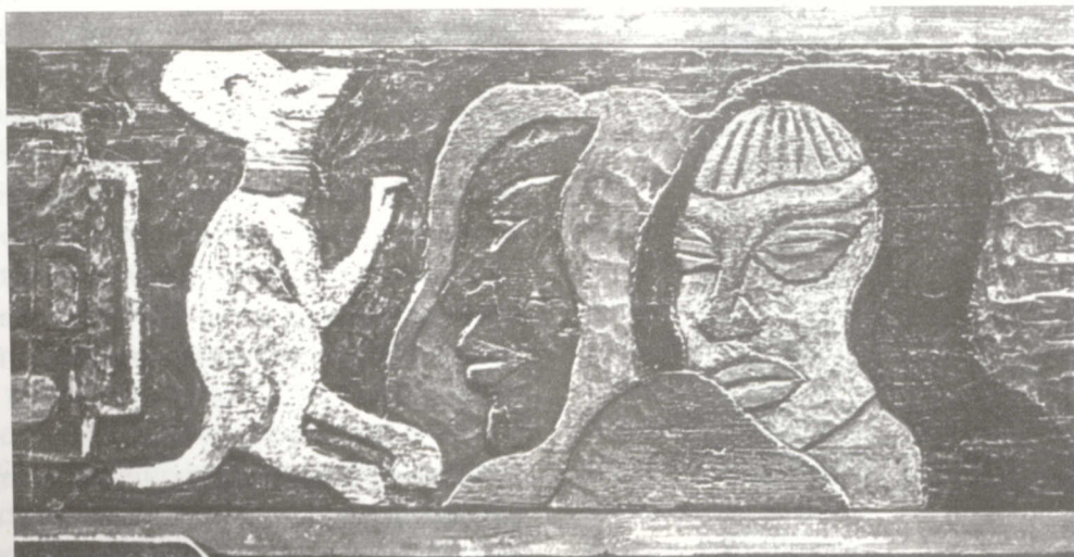
Te Fare Amu. Gauguin

Como podemos ver las posibilidades de innovar nuestra práctica docente haciéndola más atractiva a los alumnos con la incorporación de las tecnologías educativas, son enormes. Creo que todo depende del compromiso que tengamos con nuestro trabajo docente, con los sujetos con los que interactuamos en las aulas y con la institución en la que trabajamos. El compromiso y nuestra voluntad, en juego con nuestra creatividad, nos permitirán diseñar las formas para incorporar los avances de la tecnología en nuestra práctica docente.